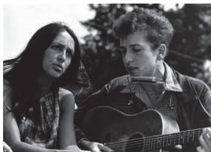
B. Dylan and Joan Baez

No Direction Home , a M. Scorsese doc., The Greenwich Village clip : part1, chap. 5 - Village bohemia/freedom from bad tradition/Ginsberg/Ginsberg reads America . Ginsberg on Hard Rain . https://youtu.be/DPW5o3FCpWQ